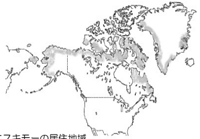
*エスキモーの居住地域

エスキモーの伝統的な食生活は狩猟によって得た生肉が中心です。アザラシやセイウチ、クジラ、カリブー(トナカイ)などの大型海獣・動物、サケやマスなどの魚を捕獲していました。寒冷な気候のために植物採集によって栄養を得ることは困難ですが、その代わりに生肉を食べることで、ビタミンCやビタミンDといった栄養を摂りました。もし、エスキモーの人びとが肉を煮たり焼いたりして食べ続けたら…必要な栄養が摂れず、病気になってしまうかもしれません。