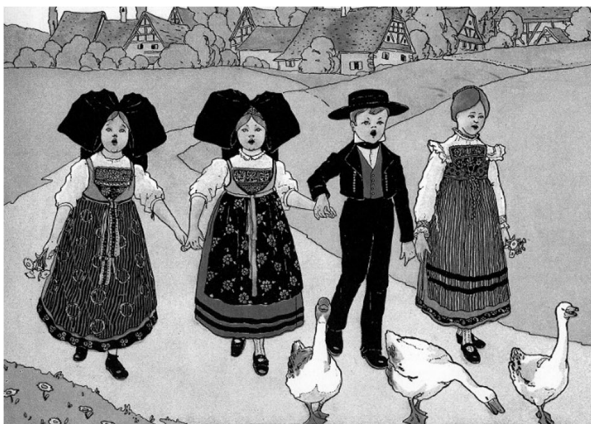
出典：「Mon Village」, Hansi 作

アルザス地方の女性の伝統衣装は、ギャザースカート、黒い胸飾りがついたブラウス、頭には蝶結びのリボンをつけたものが一般的です。リボンをつける習慣は、19世紀初めから広まったとされています。男性は、黒いズボンと上着、赤いベストを着て、帽子をかぶります。女性のリボンは信仰する宗教によって大きさが異なっており、大きいものはプロテスタント、小さいものはカトリック教徒であることを表しています。